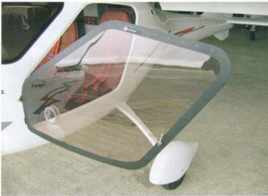
Einstieg in die Oberklasse: Über weit öffnende Türen geht's ins Cockpit. Selbst Piloten bis 1,90 Meter haben dort komfortabel Platz

Die Steuerharmonie die Topaz ist hervorragend, und ihre 45-Grad-Rollwendigkeit von nur 1,9 Sekunden bei 115 km/h gibt ihr die Hand-