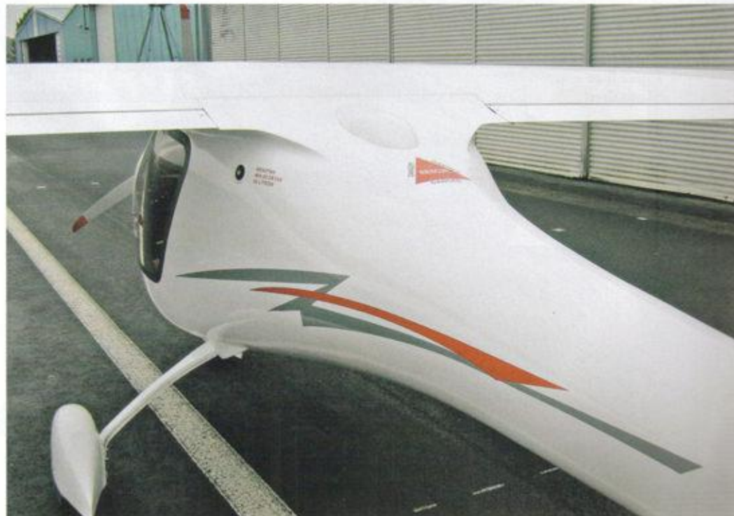
Wichtige Öffnungen: Der Tankstutzen sitzt gut zugänglich links hinter der Tür. Das Rettungssystem schießt hinterm Flügel nach oben aus

Mit den Klappen auf Stellung 1 (15 Grad) und leicht gezogenem Knüppel beschleunigt der Hochdecker schnell, hebt das Bugrad und ist nach erstaunlich kurzer Rollstrecke in der Luft. Dabei benötige ich nur einen sehr geringen Sei-